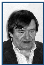
Technicko-hospodářský pracovník DPP 0,1