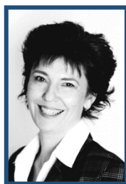
Sociální pracovník 1,0 Vedoucí služby DPP 0,1