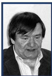
Technicko-hospodářský pracovník DPP 0,1